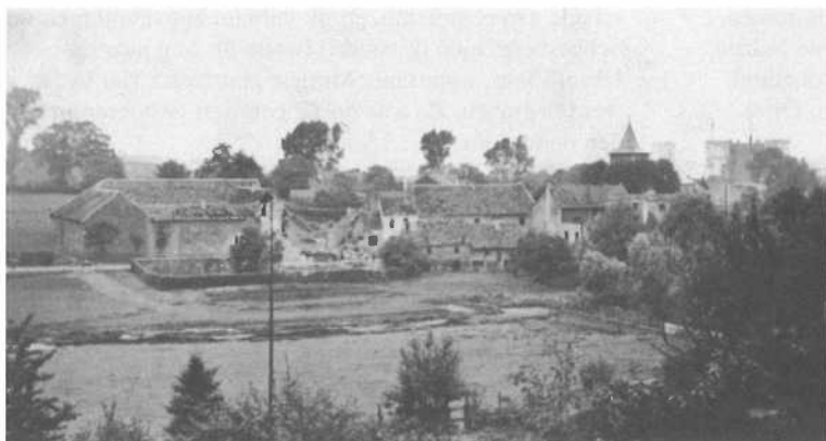
Verwoestingen Torenstraat Eygelshoven.

formaties blijven vliegen en het meer licht wordt, kan ik ze nu ook zien. Intusschen wordt het duidelijk wat er aan de hand is. De Duitschers zijn ons land binnengevallen. Onze soldaten schieten op aanvallers en vliegtuigen. De groep, die aan het kerkhof ligt, trekt zich terug en fietst stom de Torenstraat op. 6) Dan loopt de roep, dat Duitschers met geweren in den aanslag en met bajonetten bezet ons dorp binnensluipen. Vervolgens verschijnen gemotoriseerde eenheden op de Laurastraat, die aangroeien tot colonnes. De Torenstraat loopt leeg om te gaan kijken. Ik ben nog alleen in bed, want ik wil de schenners van ons grondgebied geen belangstelling waardig keuren. Tegen den tijd, dat de eerste Hl.Mis begint, ga ik naar de kerk. Dan zie ik, wat er aan de hand is, de laatste soldaten en paarden van een colonne zie ik de Laurastraat op verder trekken. De menschen staan ze na te staren. Sommigen hebben betraande oogen. Dien dag is er van werken geen sprake meer. De mijnen liggen stil. Iederen voelt zich onbehaaglijk. Ik luister naar de radio om nieuws te vernemen. Vliegvelden worden in geheel het land aangevallen. Parachutisten dalen op veel plaatsen. De Duitschers zijn over de oostgrens van het geheele land binnengerukt.