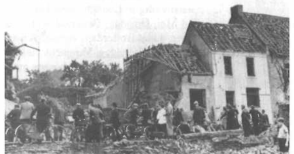
Verwoesting Huize Henskens.