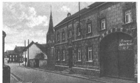
Aansichtkaart van de brouwerij