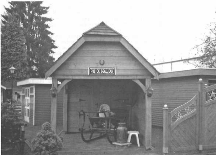
Tuinhuysje van Leentje aan de 'Rue de Beaujean' te Heerlerheide (foto auteur 2007).