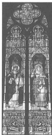
Glas-in-lood raam in de St. Louis kerk, Buffalo, NY.