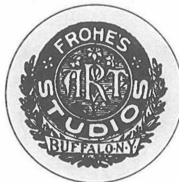
Logo Firma Frohe.