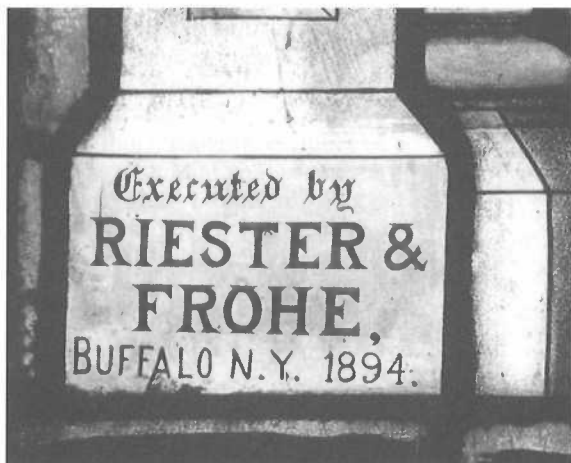
Detail van links beneden.