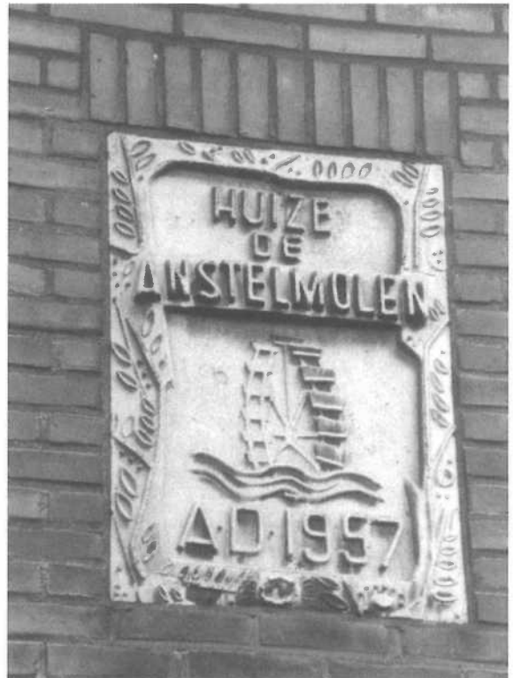
Huize de "Anstelmolen A.D. 1957" met schoepenrad in 1989 gelegen aan de Molenweg te Kerkrade-Eygelshoven, gebouwd door de laatste molenaar.