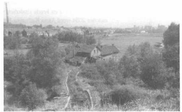
De Bauranstelermolen gezien vanaf de spoordijk van het Miljoenenlijntje circa 1960. Het aanvoerkanaal is al dichtgegroeid. Rechts nog gedeeltelijk zichtbaar de Anstelerbeek en op de achtergrond de mijn Julia te Eygelshoven.

In vlakke gebieden met veel water komen we de Middenslag molen tegen. 5) Door een, of meer sluizen wordt het verval vóór de molen verhoogd. De toevoer naar het rad gebeurt via de maalsluis, het stuwpeil door de lossluizen die ook het overtollige water afvoeren. Zakt de maalsluis stroomt het water met kracht ter hoogte van de as op de schoepen of in de bakken. Op het laagste punt stroomt het water dan pas weg. Hier wordt dus zowel het gewicht als de stroming benut voor de opwekking van energie. Bij een volkomen effen landschap worden Onderslag molens ingezet op en beek met een grote watertoevoer. Ter vergroting van de snelheid wordt de maalsluis zo dicht mogelijk vóór het rad geplaatst. Wordt de maalsluis omhoog getrokken, spuit het water door een smalle spleet met kracht op de gebogen of rechte schoepen aan de onderkant. Om het natuurlijk verval te verhogen heeft men bij sommige molens een apart kanaal aangelegd, de zogenaamde molentak, zoals bij de