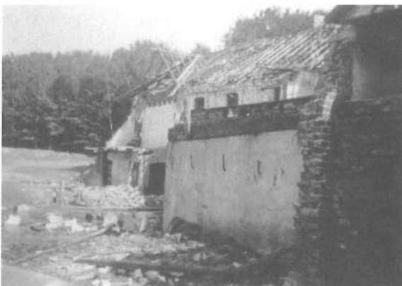
Afbraak van de "Egelse Mühle" in de jaren zestig van de vorige eeuw.