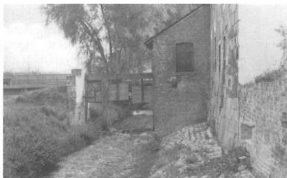
De Baalsbruggermolen gezien in de richting van Herzogenrath tegen de stroomrichting in met de sluisen open. Rechts nog zichtbaar het gat van de molenas; in de aanbouw de turbine die inmiddels is verzand.

Over een molen te Eyselshoven is ook reeds sprake in 1546 wanneer de Heer van Bongard daaromtrent inlichten vraagt bij de Keurkeulische Mankamer te Heerlen. 19)