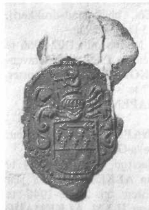
Detail zegel Gerard van Schelbergen, 6 september 1661. Bron als bij afb. 3, inv. nr. 2317, port. 398. Foto gemeentearchief Venlo.

zeker is dat deze afstamming via de mannelijke lijn loopt. De nakomelingen van Symon van Schelberg uit Oirlo (geb. ± 1561), die heden ten dage de naam Aerts dragen, stammen met zekerheid uit de mannelijke lijn van de familie Van Schelberg. 10)