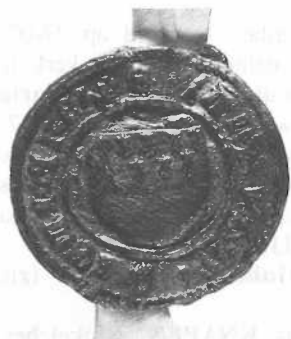
Zegel van Jennesken van Schelberg Gerardszn., 11 juli 1419. Randschrift: + S(igillum) Jan van Scelberch. RAL, Charters: Charterdoos Arcen (schepenbank), IA III 28.