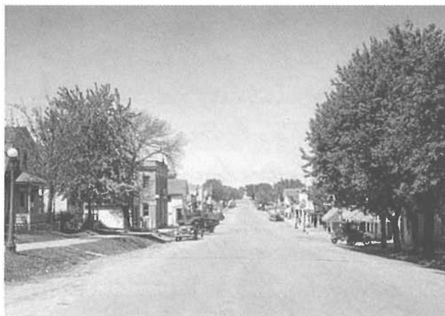
Waconia, Carver County, Minnesota, ong. 1910.