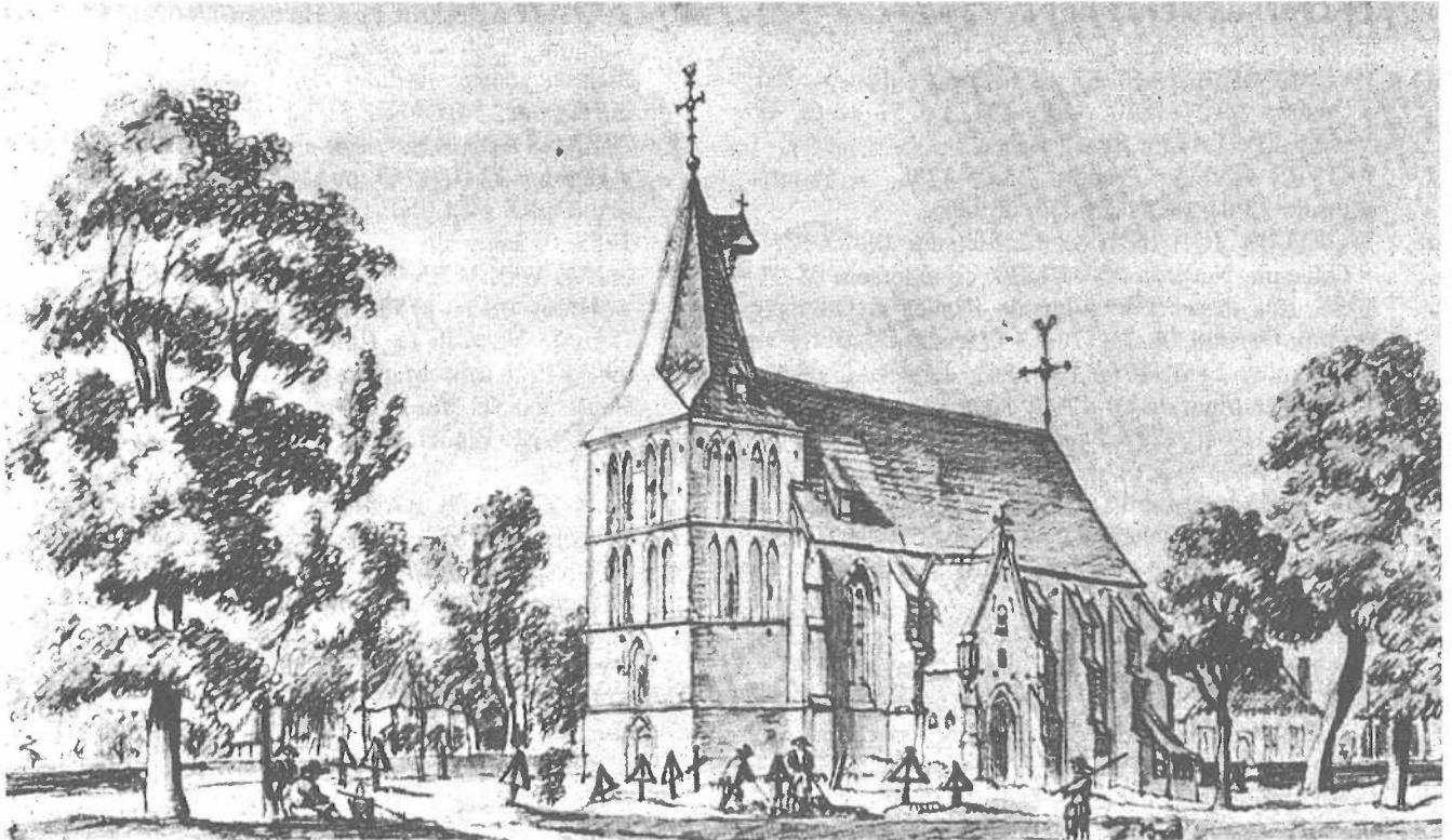
Kirche zu Asperden.