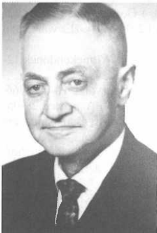
Peter Johann Janssen.