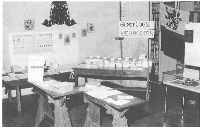
Ook de toen nog jonge Sectie Genealogie presenteert zich op de genealogische tentoonstelling van het Rijksarchief, in 1974. (foto RAL; H.L. Mordang).

Limburg speelt dus al langer een voortrekkersrol, met een duidelijke impulsie, al in de jaren 1970, van het Rijksarchief. Tegenwoordig lijkt het wel eens, wanneer men rapporten en beleidsstukken leest, alsof de Rijksarchiefdienst, als een 'Schone Slaapster', met een schok ontwaakt uit een lange en diepe slaap, en met verrassing constateert dat de studiezalen voor 80% bevolkt worden door genealogen. Het was natuurlijk al langer bekend dat genealogen landelijk de grootste groep bezoekers vormden (26.500 per jaar in 1993), en niet-genealogen de kleinste groep (5.500 bezoekers). Maar iets anders is dat men deze groep ook als zodanig, en actief, gaat waarderen en benaderen.