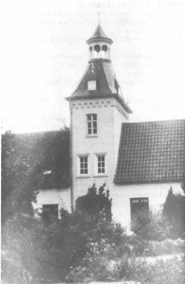
Hoofdgebouw met toren van boerderij "De Arenborg" 1987.