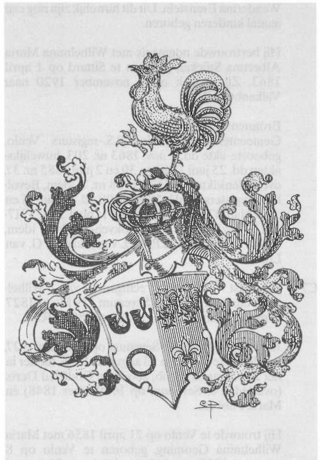
Familiewapen Van Liebergen.