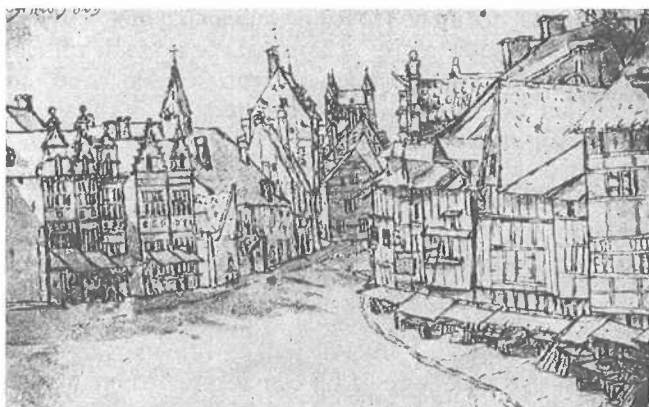
Gezicht in de Hoogbrugstraat te Wyck-Maastricht, 1669. Pentekening toegeschreven aan Valentijn Klotz. Collectie L.G.O.G.

Het hoge huis links van het midden is de poort van Beusdael, aldus Van Heyst in zijn aangehaalde artikel. Daarvóór moet dan liggen het St.-Gilles-gasthuis en de St.-Gilles-kerk met torentje, die grenst aan De Schenckepoorte. Het dak, uitstekend boven de huizenrij links vooraan, moet dan De Vroenhof of De Poort Van Gulpen zijn. De kerk met de twee torens op de achtergrond is de aan de overkant van de Maas liggende O.L.V.-basiliek.