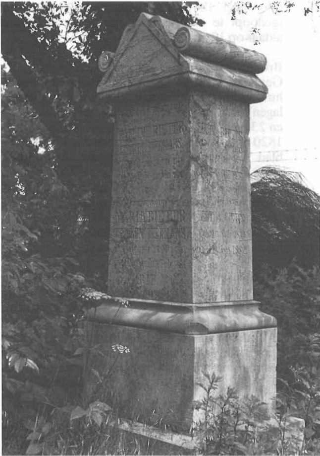
Foto van graf B70, familie Rieter.

te Tegelen op 16 april 1823, overleden aldaar op 10 mei 1867).