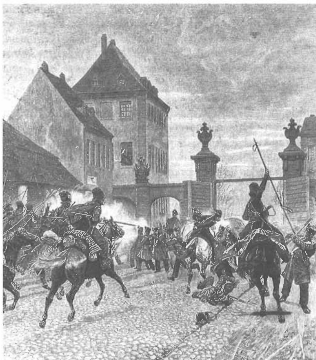
Franse soldaten en ingelijfdens leveren slag tegen de Kozakken bij de Hallesche Poort te Berlijn op 4 maart 1813. Naar een schilderij van R. Knötel.