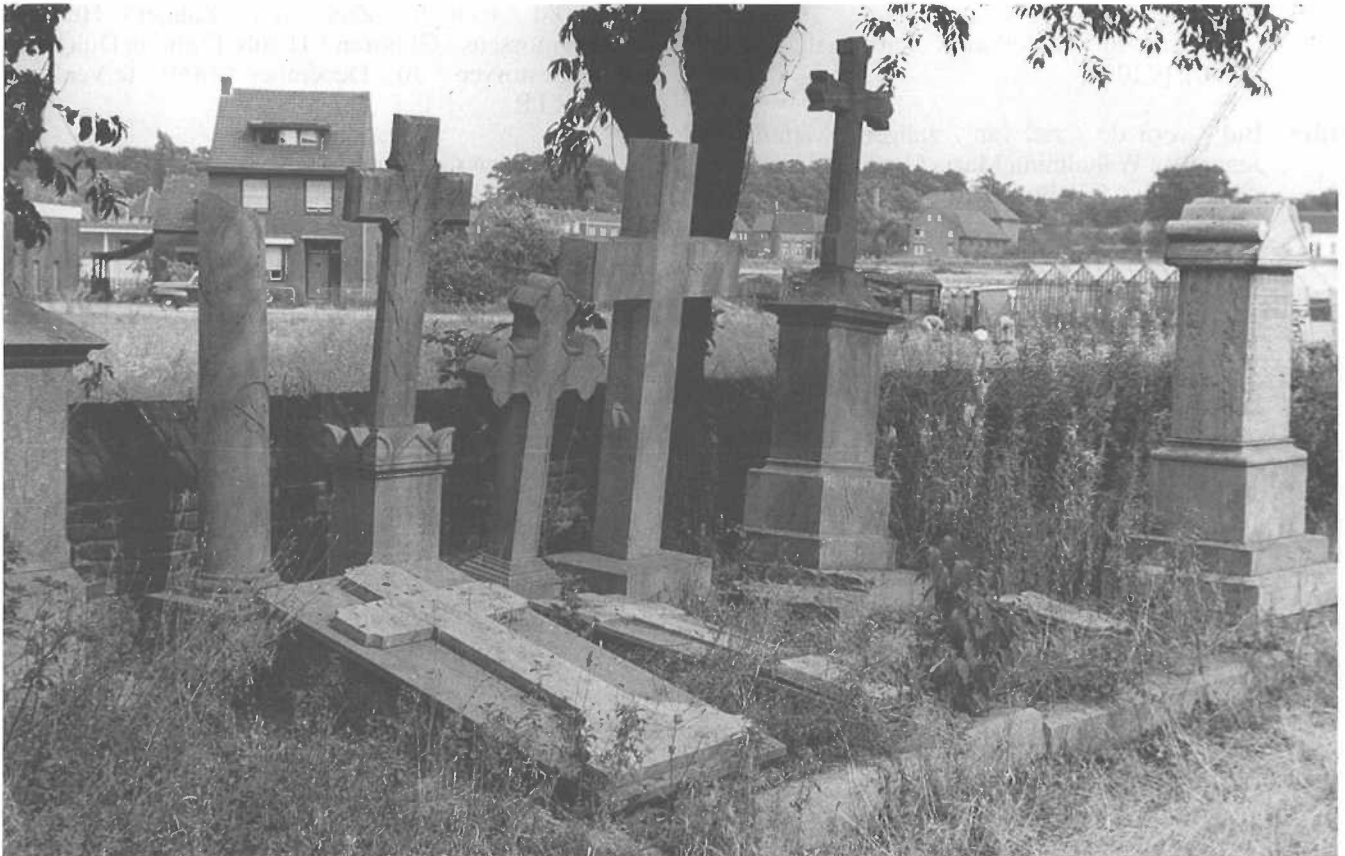
Overzichtsfoto van de graven B60 - B70;

v.l.n.r.: links, half op de foto is graf B60; de zuil is graf B61; daarvoor de platte steen met verhoogd kruis is graf B62; hoge kruis op gekanteeld onderstuk is graf B63; lage kruis met geschulpte uiteinden is graf B64; daarvoor platte steen met verhoogd kruis en opengeslagen boek is graf B65; hoge rechte kruis is graf B66; daarvoor bijna onzichtbaar graf B67; kruis op hoog onderstuk is graf B68; daarvoor steen met opengeslagen boek is graf B69; geheel rechts is graf B70.