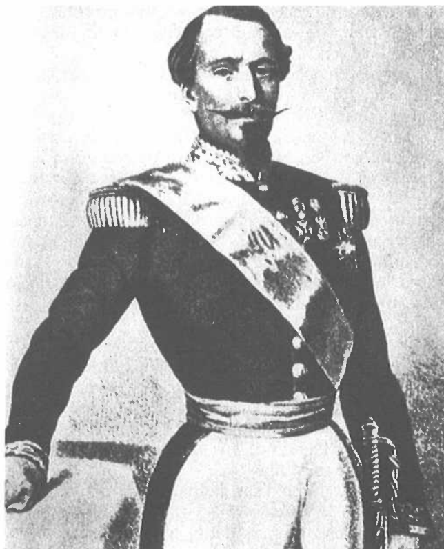
Napoleon III (1808-73).

Zoals we gezien hebben begon de grote stroom van vrijwilligers uit ons land naar Rome eerst goed op gang te komen in de tweede helft der zestiger jaren van de vorige eeuw. Daaronder moeten er velen zijn geweest die hier te lande militie-plichtig waren en zodoende ook, als zij dat al zouden hebben gevraagd, nimmer koninklijke toestemming hadden verkregen voor dienstneming in het Pauselijke leger, hetgeen beschouwd werd als het zich begeven in vreemde krijgsdienst. Het ontbreken van die toestemming had als gevolg dat de betrokkenen zijn Nederlandschap verloor. Voor velen die op dit punt in