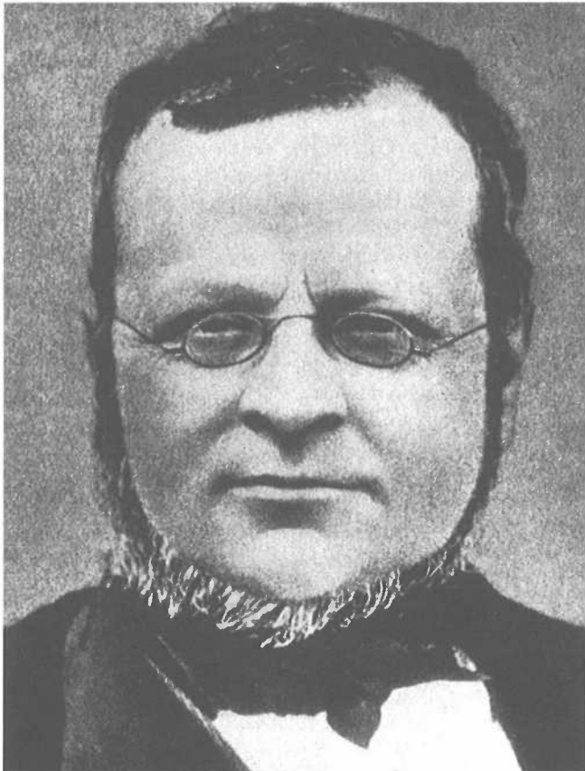
Camille Cavour (1810-61). Fotografie.