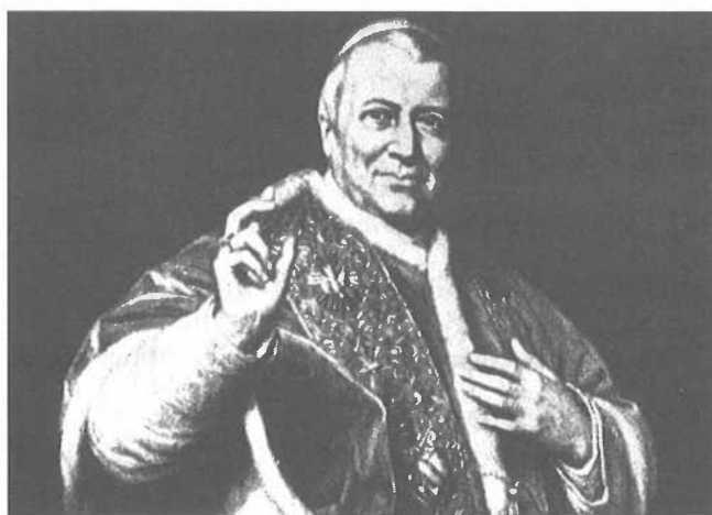
Paus Pius IX (1846-78). Portret door G.F. Healy, Casa Mastai, Senigallia.

Nadat in het revolutiejaar 1848 in Europa de beginselen van het liberalisme en het daaruit voortvloeiende natio-