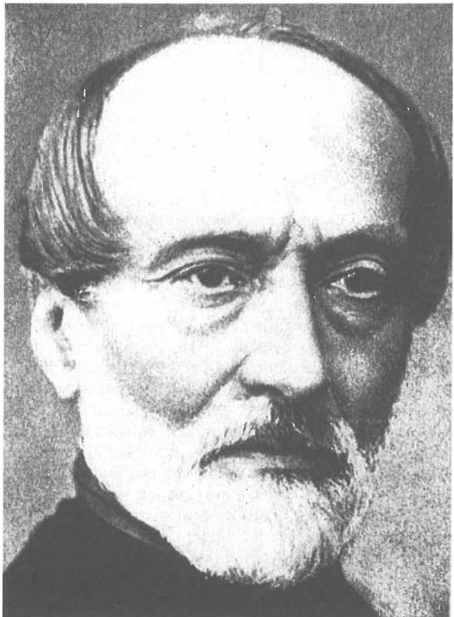
Giuseppe Mazzini (1805-72). Fotografie.