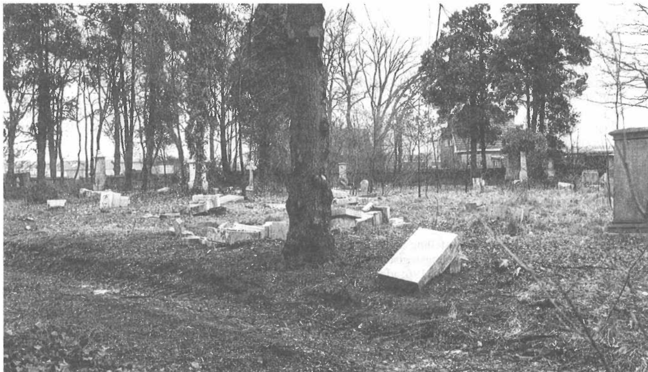
Gezicht op vak B vanuit het kruispunt van de paden tussen de vakken A-B-C en D. Geheel rechts is graf 8B zichtbaar.