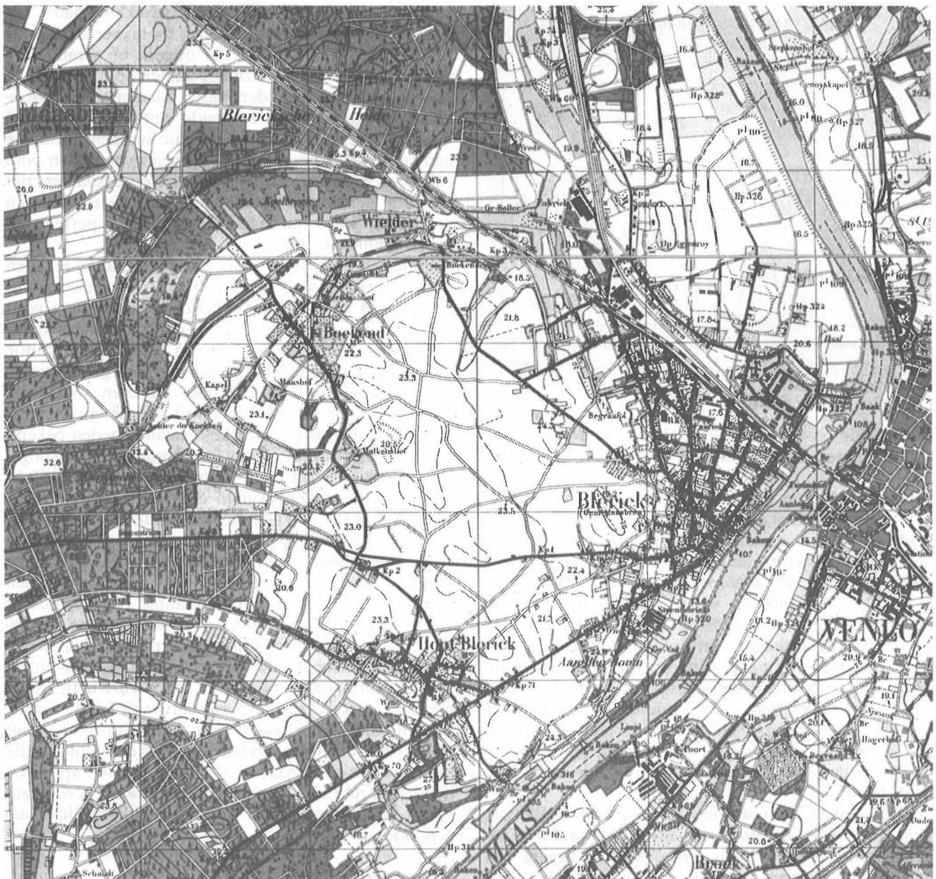
Blerick op de topografische kaart van 1934 met de drie buurtschappen Dorp, Boekend en Hout-Blerick.

van Blerick, dat begrensd werd door de Maas in het oosten, de kerspelgrens met Grubbenvorst in het noorden en een lijn, waarbinnen Egtenray, gerHeien, de Klingerbergh en de Delle lagen, in het westen. In dit gebied lagen o.a. het Maasveld, de Wieën, de Schans en het Ubroek. Belangrijke boerderijen waren Egtenray, gerHeyen, aengenEynd, opdeSomp, de Staay, het Reynersgoed en de Schotelkenschhof. Ten zuiden van het dorp begon Hout-Blerick.