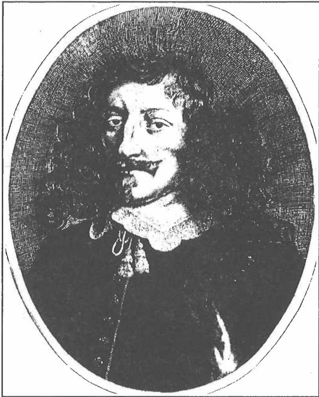
Philip Willem hertog van Gulik-Kleef-Berg (1653-1690), vanaf 1685 keurvorst van de Palts.

Rheinisches Bildarchiv, Stadtmuseum Köln.