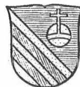
Familiewapen Wetzel genaamd von Fleckenstein

Evenals de familie Balthasar was de familie von Fleckenstein een patriciërsfamilie te Luzern.