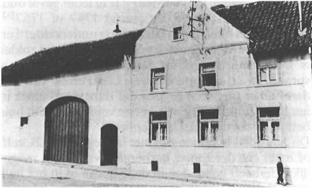
Vooraanzicht rond 1953.

Met deze inventarisatie van de roerende boedel, geordend door en aangevuld met de gegevens van Leo Pelzer, kon ik een plattegrond maken van de boerenhoeve. Zoals gezegd is deze boerderij voorheen al van aanzicht veranderd met de uitbouw van de zolder (zie foto).