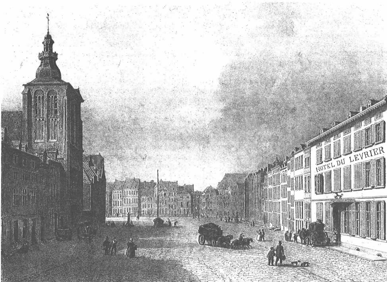
De Boschstraat, met links de Matthijskerk, naar een negentiende-eeuwse gravure (RAL, prentencollectie, nr. 85).

Het is typerend voor de betrekkingen dat zij met burgers van Maastricht onderhielden, dat de jongste