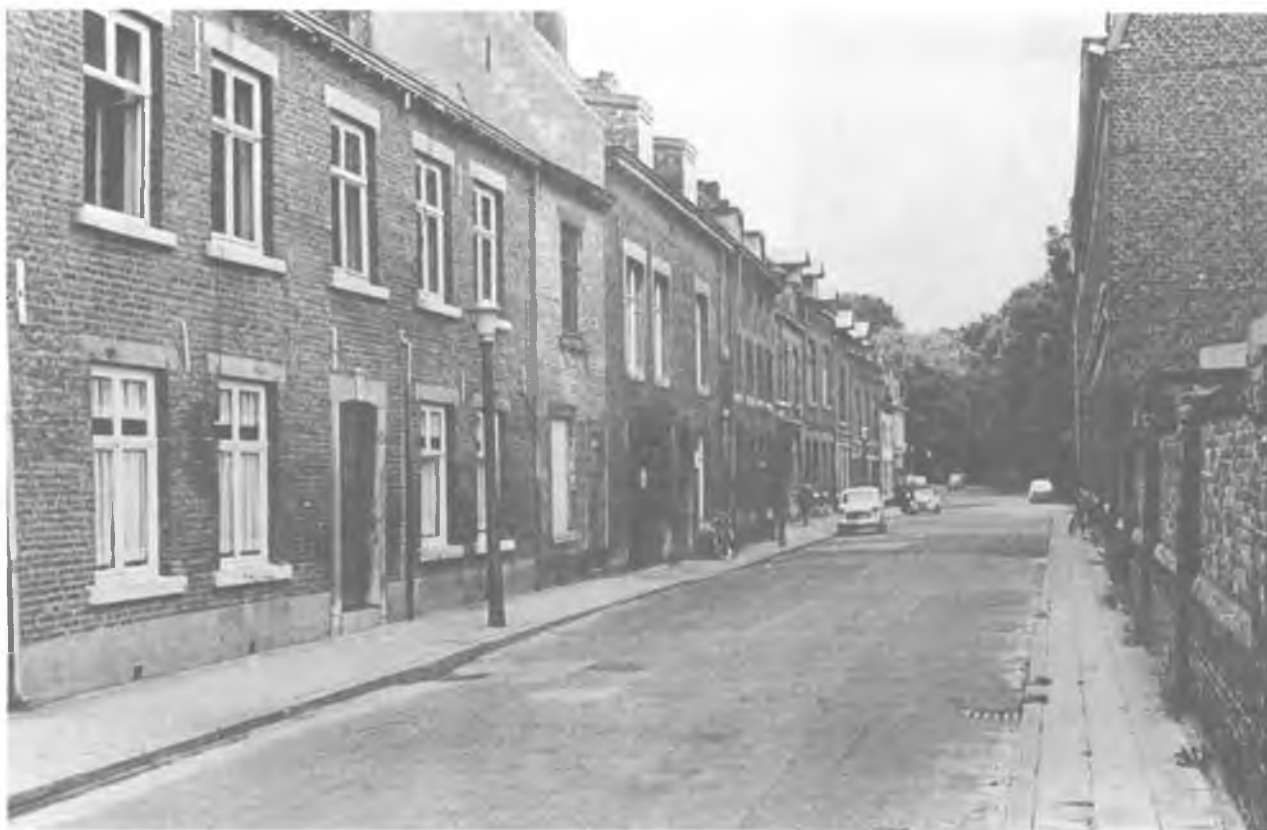
De Oeverwal te Wyck-Maastricht omstreeks 1930. Hier woonde het echtpaar Bouvrie-Nijpels het grootste gedeelte van hun leven.