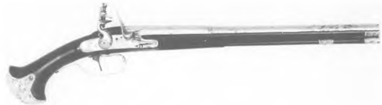
Pistool van Joost de la Haye, uit de collectie W.A. Stryker, Wyandotte, Michigan, USA.

Lit.: A. Hoff, p. 79-80 en kleurenfoto Plate VI; Lakenhal, nr. 24 (met afbeeldingen).