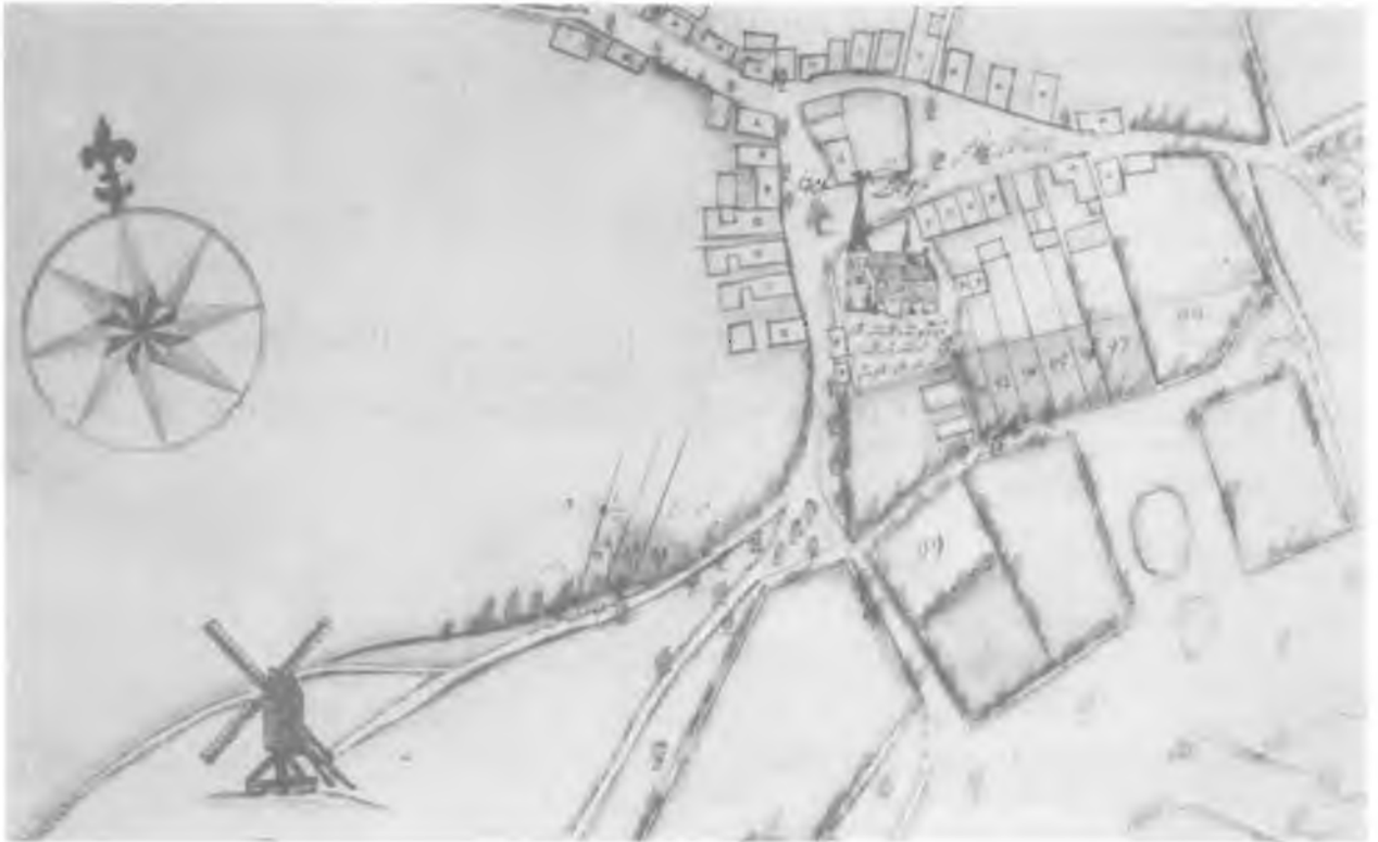
Het dorp Helden in 1739. Tiendenkaart van de koning van Pruisen, Hauptstaatsarchiv Düsseldorf, Karten 2826.