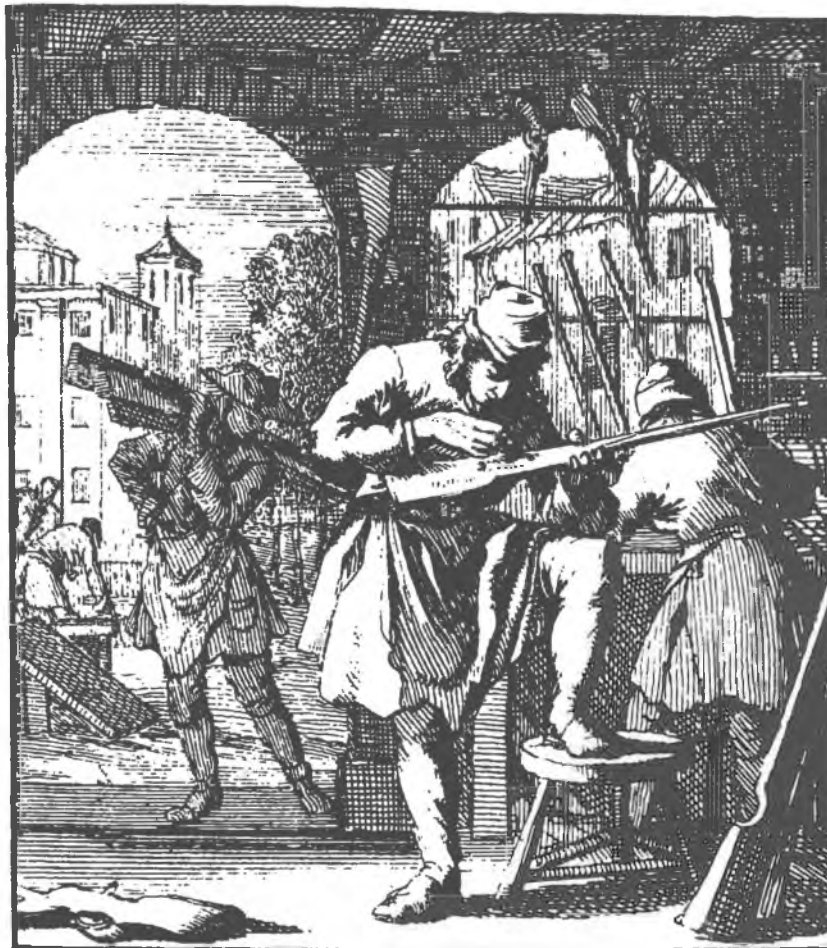
De Roeremaaker, illustratie uit: Johannes en Caspar Luiken, Het Menselyk Bedryf (Amsterdam 1694).