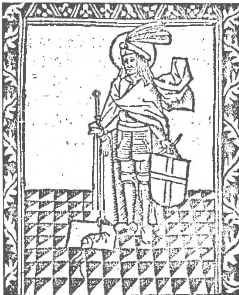
Bildnis des hl. Gommars - Holzschnitt der Inkunabel „Dits die excellente cronike van Brabant“. Löwen, Kath. Universität (15. Jh.).

An dieser Stelle möchte ich all denjenigen meinen herzlichen Dank aussprechen, welche mir bei der Zusammenstellung der Ahnenliste GOMMANS-DERKS hilfreich die Hand geboten haben. Da die Nachforschungen nach unsern Voreltern aber nie zu einem Abschluß kommen, bin ich auch in Zukunft dankbar für jede Ergänzung oder Korrektur. Andererseits bin ich natürlich jederzeit gerne zu Auskünften bereit, zumal von den meisten der aufgeführten Familien komplette Familienlisten vorliegen.