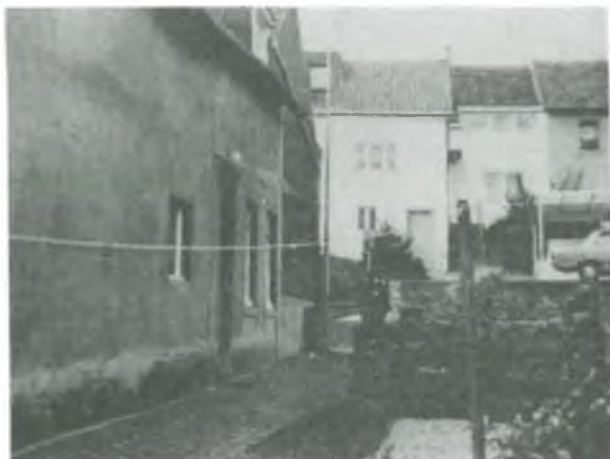
Sterfhuis van Martinus Plum te Rimburch