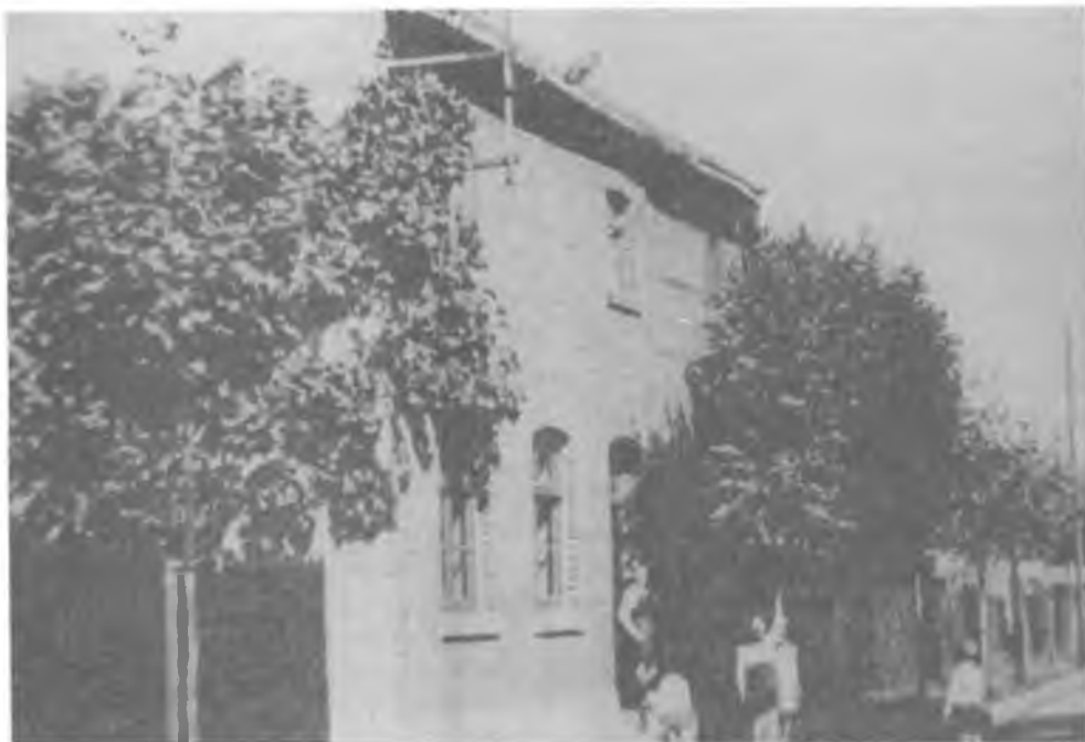
Woonhuis van de familie Wolters-Plum in de Grenstraat te Ubach over Worms